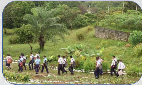
Los estudiantes caminando hacia el colegio.