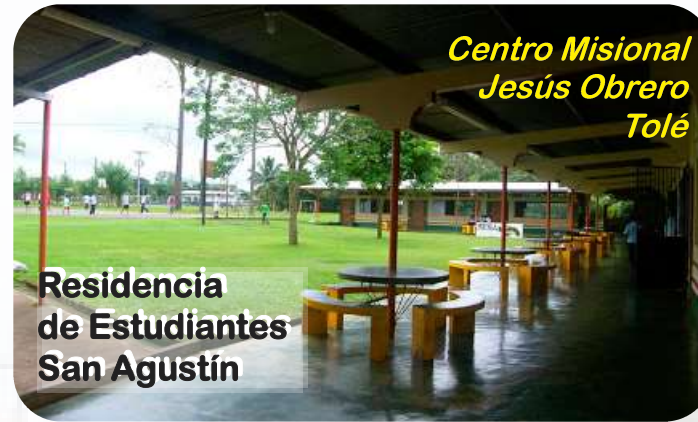
Centro Misional Jesús Obrero Tolé