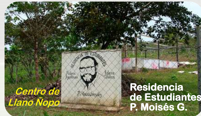
Centro de Llano Ñopo