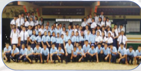
Todos los estudiantes de RESA 2017

de grandes crecidas, tierras poco aptas para el cultivo y con una población que vive dispersa en pequeñas comunidades locales. El 70% de la población pertenece a la