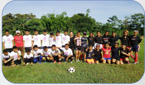
Equipos de premedia masculino y femenino.

La Parroquia de San José Obrero de Tolé está encomendada a los religiosos agustinos que desarrollan su labor pastoral a través del Centro Misional Jesús Obrero.