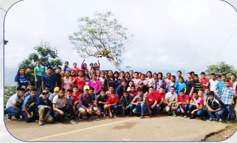
Los estudiantes al final de una celebración agustiniana.