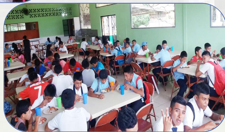
Los estudiantes de RESA disfrutando de su hora de almuerzo.