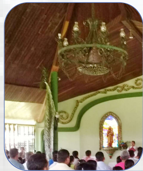
Papás y estudiantes en la Eucaristía con el Cardenal, Mons. José Luis Lacunaza.

una parte de la escolarización anual de un estudiante al contribuir a su alimentación, residencia, formación y materiales de apoyo escolar.