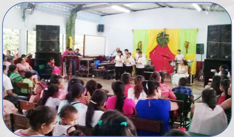
Acto cultural de los estudiantes de RESA

etnia indígena Ngöbe, lo que hace que ésta sea una misión con constantes y grandes retos en el plano de la promoción social y la inculturación del Evangelio.