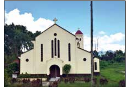
Iglesia de S. Pedro de la misión de Lubuagan

Desde su llegada – hace tres años-, los agustinos han fundado en total 15 pequeñas comunidades en toda la ciudad. Sin embargo, hasta el presente, no todas estas 15 “mission stations” tienen su propia capilla. Por eso, durante las misas y otras celebraciones litúrgicas, éstas tienen lugar en casas privadas o en cualquier espacio libre de la zona. Teniendo en cuenta la gran cantidad de comunidades de misión diseminadas