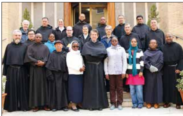
Participantes en el Curso de Espiritualidad con el P. General