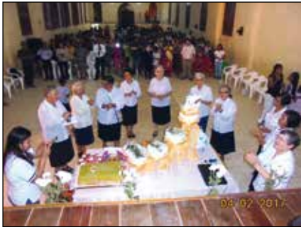
Agustinas celebrando el 50 Aniversario

capilla de San Regis, el pueblo más antiguo de la parroquia, ya que la fundación de Nauta (1830) se establece bajo la jurisdicción del curato de San Regis. La construcción del Centro Comercial LA CASONA está también ligada al Centenario.