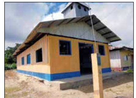
Capilla de San Regis, Nauta.

3.- Del mismo modo se ha fortalecido a partir del 2014 la catequesis en las zonas. La importancia de la catequesis para la evangelización es tema destacado de la Iglesia en los últimos años. En Nauta aún seguimos necesitando más catequistas para poder atender con este servicio a todas las zonas.