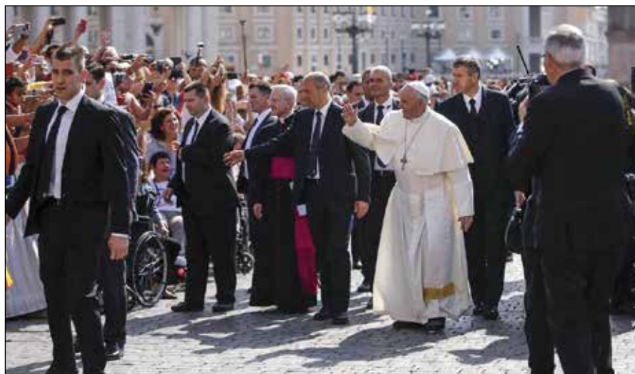
Llegada del Papa Francisco a la Plaza S. Pedro.