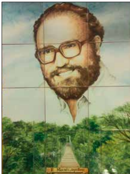
Mosaico con el retrato del P. Moisés.

- Se alimentaba de la Celebración Eucarística