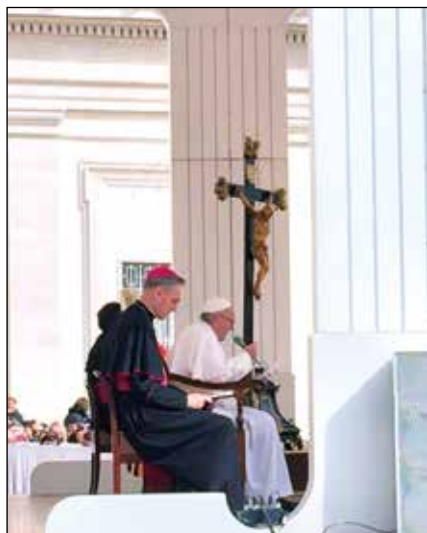
Papa Francisco en una audiencia

fortalecedora que, gracias al mismo Espíritu, indica caminos y estrategias nuevas de testimonio y de proximidad; y por medio de la Eucaristía se convierte en el alimento del hombre nuevo, «medicina de inmortalidad» (Ignacio de Antioquía, Epístola ad Ephesios , 20,2).