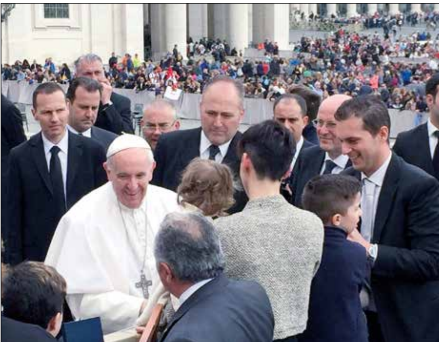
Papa Francisco en la Plaza S. Pedro.

4. Recordemos siempre que «no se comienza a ser cristiano por una decisión ética o una gran idea, sino por el encuentro con un acontecimiento, con una Persona, que da un nuevo horizonte a la vida y, con ello, una orientación decisiva» (Benedicto XVI, Carta enc. Deus caritas est , 1). El Evangelio es una persona, que continuamente se ofrece y continuamente invita a los que la reciben con fe humilde y laboriosa a compartir su vida mediante la participación efectiva en su misterio pascual de muerte y resurrección. El Evangelio se convierte así, por medio del Bautismo, en fuente de vida nueva, libre del dominio del pecado, iluminada y transformada por el Espíritu Santo; por medio de la Confirmación , se hace unción