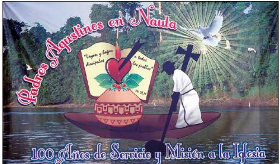
Cartel conmemorativo de los 100 años de presencia de los agustinos en Nauta.

La llegada de los agustinos a Nauta significó un reto para los agustinos, una gracia para nuestra parroquia y para el Vicariato, así como un momento de esperanza para Nauta y para los caseríos, con repercusión en lo religioso, en lo cultural, en lo social, en lo educativo y en lo deportivo.