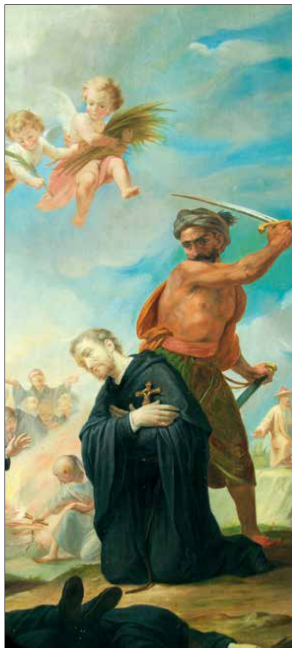
Martirio del Bto. Hernando de Ayala en Japón en 1617. Detalle de Pintura del S. XIX. Real Colegio-Seminario PP. Agustinos, Valladolid.