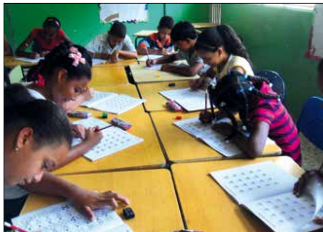
Escuela de apoyo en La Vega, República Dominicana.

El proyecto es ambicioso: su objetivo general es que todos los alumnos alcancen la cobertura, calidad y equidad educativa y sentar bien las bases para