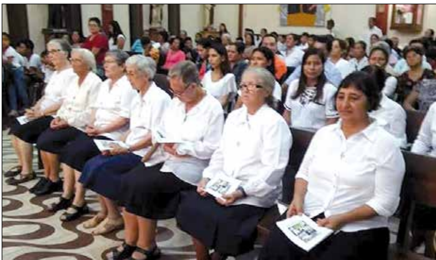
Religiosas agustinas celebrando los 50 años de presencia en Nauta

LA LLEGADA DE LOS AGUSTINOS A NAUTA FUE UNA GRACIA PARA NUESTRA PARROQUIA. UN MOMENTO DE ESPERANZA PARA LOS CASERÍOS, CON REPERCUSIÓN EN LO RELIGIOSO, EN LO CULTURAL, EN LO SOCIAL Y EDUCATIVO.