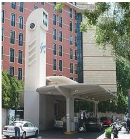
Gasolinera Gesa (antes Pi)