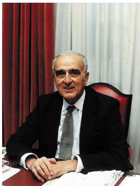
Joaquín Ruiz Giménez

democracia. Me falta un ministro, para hacer los siete, pero hablaré de este séptimo después.